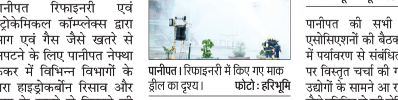
पानीपत। रिफाइनरी में किए गए माक डील का दृश्य।