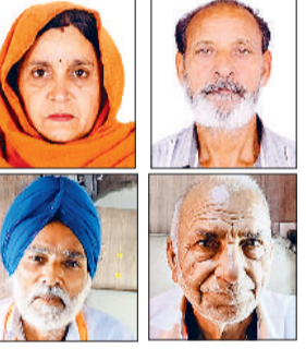
शहजादपुर। यात्रा से लौटा श्रद्धालुओं का जग्था अनुभव साझा करते श्रद्धालु।

अयोध्या धाम की पावन यात्रा पूरी कर विशेष ट्रेन लौटे श्रद्धालु बेहद खुश हैं। श्रद्धालुओं का कहना है कि यह यात्रा उनके जीवन की सबसे यादगार और आध्यात्मिक रूप से समृद्ध करने वाली रही। मुख्यमंत्री नायब सिंह सैनी और प्रदेश सरकार का आभार व्यक्त करते हुए ज्योदातर श्रद्धालुओं ने कहा कि 'हरियाणा मुख्यमंत्री तीर्थ यात्रा योजना' से जीवन का सपना साकार हो गया है। गौरतलब है कि 28 मार्च को मुख्यमंत्री नायब सिंह सैनी ने अंबाला छावनी रेलवे स्टेशन से अयोध्या धाम के लिए विशेष ट्रेन को हरी झंडी दिखाकर रवाना किया था। 31 मार्च को यह विशेष ट्रेन श्रद्धालुओं को लेकर वापस अंबाला