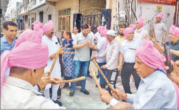
तरावड़ी। ढोल की थाप पर नाचते व नगाड़ा बजाते हुए श्रद्धालु।

तरावड़ी से आज करीब 250 श्रद्धालुओं का एक जत्था धार्मिक तीर्थ यात्रा के लिए रवाना हुआ। यह जत्था सबसे पहले अनूपना आश्रम में पूजा-अर्चना करने के बाद तीन बसों के माध्यम से आगे के लिए निकला। श्रद्धालु निजामुद्दीन से ट्रेन द्वारा अपनी आगामी यात्रा शुरू करेंगे, जो चित्रकूट, वाराणसी (बनारस) और प्रयागधाम जैसे प्रमुख धार्मिक स्थलों से होकर गुजरेंगी। यह यात्रा लगभग एक सप्ताह की बताई जा रही है। इस