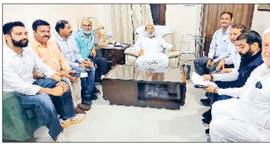
अंबाला। मीटिंग के दौरान मंत्री अनिल विज के साथ मौजूद भाजपा पदाधिकारी।

परिवहन एवं श्रम मंत्री श्री अनिल विज ने कहा कि भारतीय जनता पार्टी द्वारा पंडित दीनदयाल उपाध्याय प्रशिक्षण महाअभियान के अंतर्गत अंबाला छावनी में मंडल प्रशिक्षण कार्यशाला का आयोजन अग्रवाल धर्मशाला में 4 से 6 अप्रैल तक किया जाएगा। विज बुधवार को प्रशिक्षण कार्यशाला की तैयारियों को लेकर भाजपा मंडल प्रभारियों व मंडल