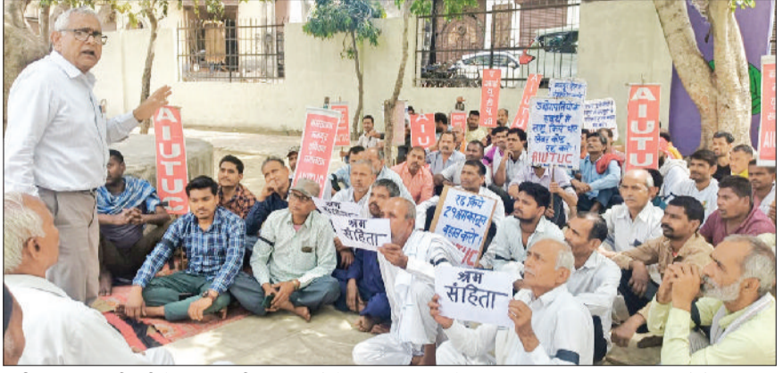
पानीपत। एआईयूटीयूसी के पदाधिकारी श्रम कानूनों के प्रति प्रदर्शन करते हुए।

चार श्रम संहिताओं के खिलाफ देशभर में बुधवार को काला दिवस मनाने के आह्वान के तहत एआईयूटीयूसी से संबद्ध श्रमिकों ने सामलखा में काला दिवस पर अपना विरोध प्रकट किया। विभिन्न उद्योगों, संस्थाओं में कार्यरत अनेक मजदूर गोल्डन पार्क सामलखा में एकत्र हुए। एआईयूटीयूसी हरियाणा के प्रदेश