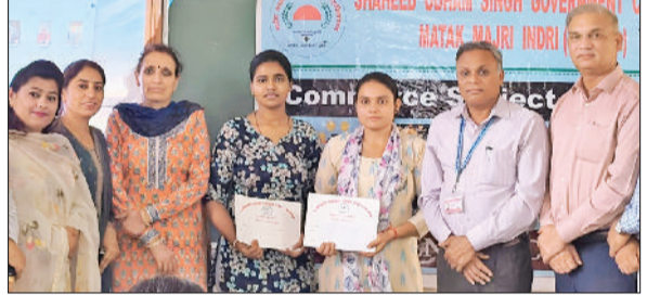
इंद्री। अवल विद्यार्थियों को सम्मानित करते महाविद्यालय के प्रोफेसर।