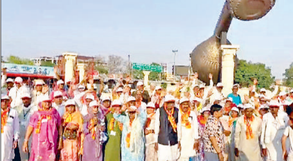
शहजादपुर। यात्रा से लौटा श्रद्धालुओं का जग्था अनुभव साझा करते श्रद्धालु।

■ सीएम नायब सैनी के साथ प्रदेश सरकार का जाता आभार, कहा जीवन में पहली बार निःशुल्क यात्रा की शानदार व्यवस्था जीवनभर रहेगी याद