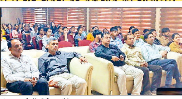
अंबाला। वर्कशॉप में हिस्सा लेते छात्र।