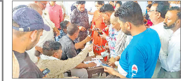
शहजादपुर। उपभोक्ताओं को गैस की उपलब्धता के लिए रसीद देते कर्मचारी।

प्रधानों से चर्चा कर रहे थे। उन्होंने कहा कि प्रशिक्षण शिविरों का मुख्य उद्देश्य पार्टी कार्यकर्ताओं के वैचारिक और संगठनात्मक कौशल को मजबूत करना है। उन्होंने कहा कि प्रशिक्षण शिविर 4 से 6 अप्रैल तक सात सत्र आयोजित किए जाएंगे जिनमें अंबाला छावनी के सदर, महेशानगर, ग्रामीण और शास्त्री मंडल के पदाधिकारी शामिल होंगे। शिविर में हर मंडल से मंडल अध्यक्ष व मंडल प्रभारी के अलावा