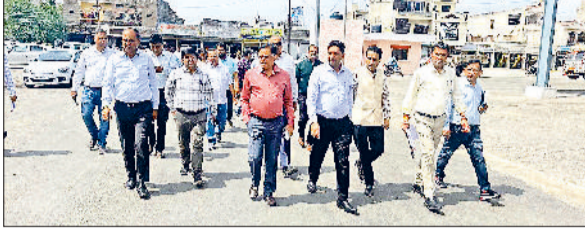
अंबाला। अनाजमंडी में खरीद कार्य को लेकर व्यवस्थाएं जांचते प्रधान सचिव विजय दहिया।

■ मंडी कारोबारियों ने मंडी में सरसों खरीद केंद्र बनाने का भी किया आग्रह